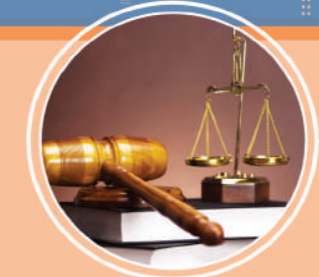
ဥပဒေပိုင်းဆိုင်ရာဝန်ဆောင်မှုလုပ်ငန်း