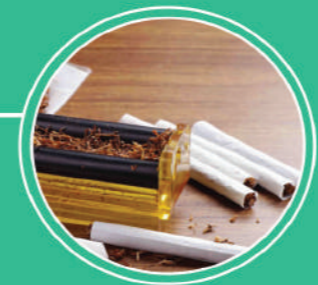
ညှော်လမ်းညွှန်လုပ်ငန်း