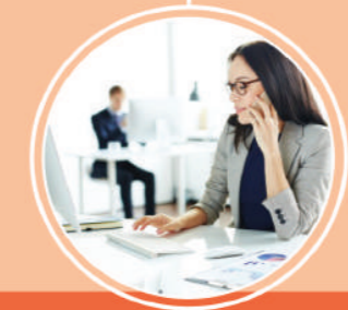
အတွင်းရေးမှူးလုပ်ငန်း