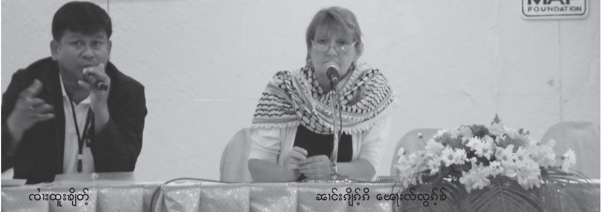
လုံးထူးချိတ်